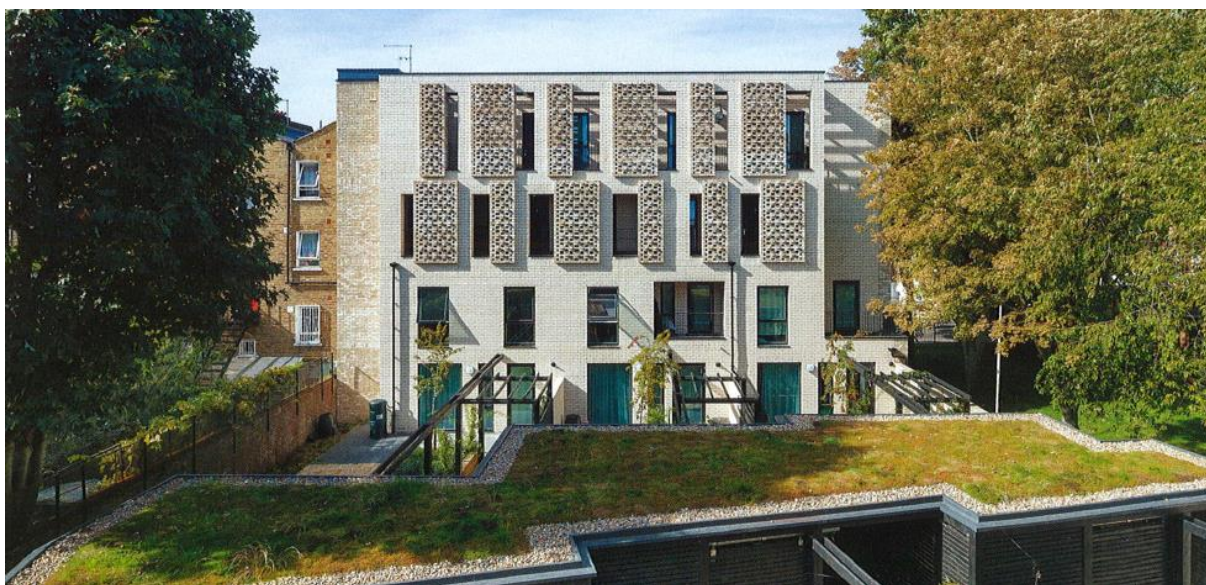
Pataky Rita sk. tárgyfelelős